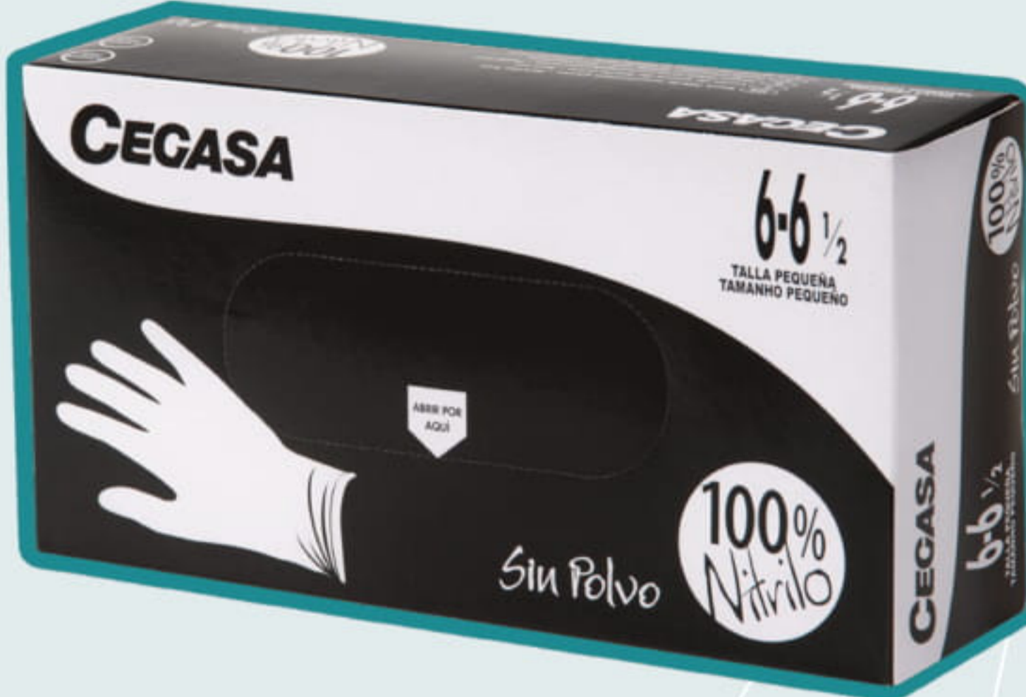
CAJA 100 GUANTES NITRILLO NEGRO/AZUL T-P, T-M, T-G COVID 19