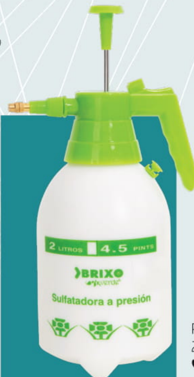
PULVERIZADOR PRESIÓN 2 litros COVID 19