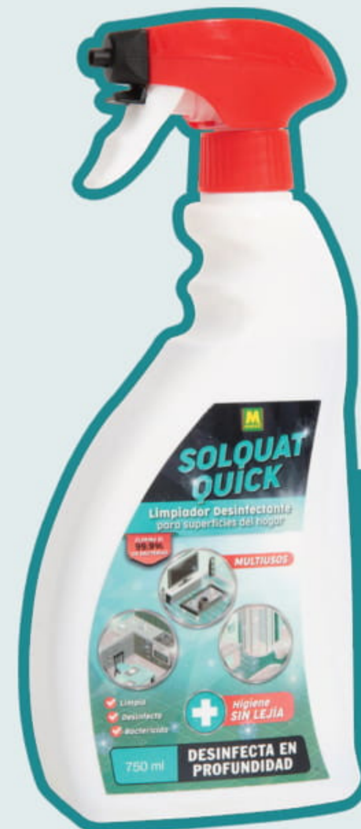
LIMPIADOR DESINFECTANTE VIRICIDA SOLQUAT QUICK 750 ml COVID 19